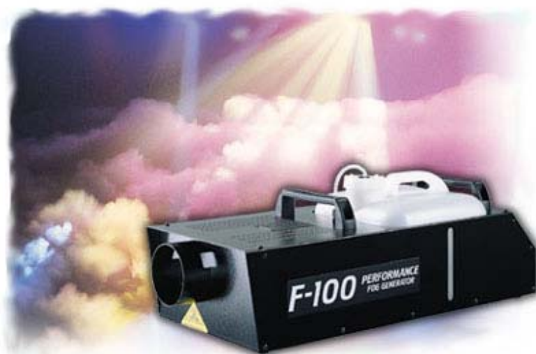
NEBELMASCHINE HIGHEND F10

Le Maitre Pyroflash 2; 2-Kanal Steuereinheit inkl. 2 Abschussrampen SFr. 30.- Pyro-Effekte: (Vulkan) auf Anfrage